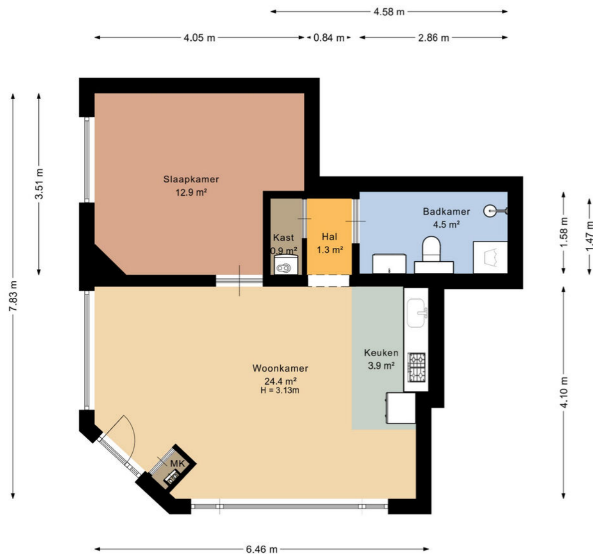
Bilderdijkstraat 9A, Utrecht Begane grond

De plattegronden zijn geproduceerd voor promotionele doeleinden en ter indicatie. Aan de plattegronden kunnen geen rechten worden ontleend.