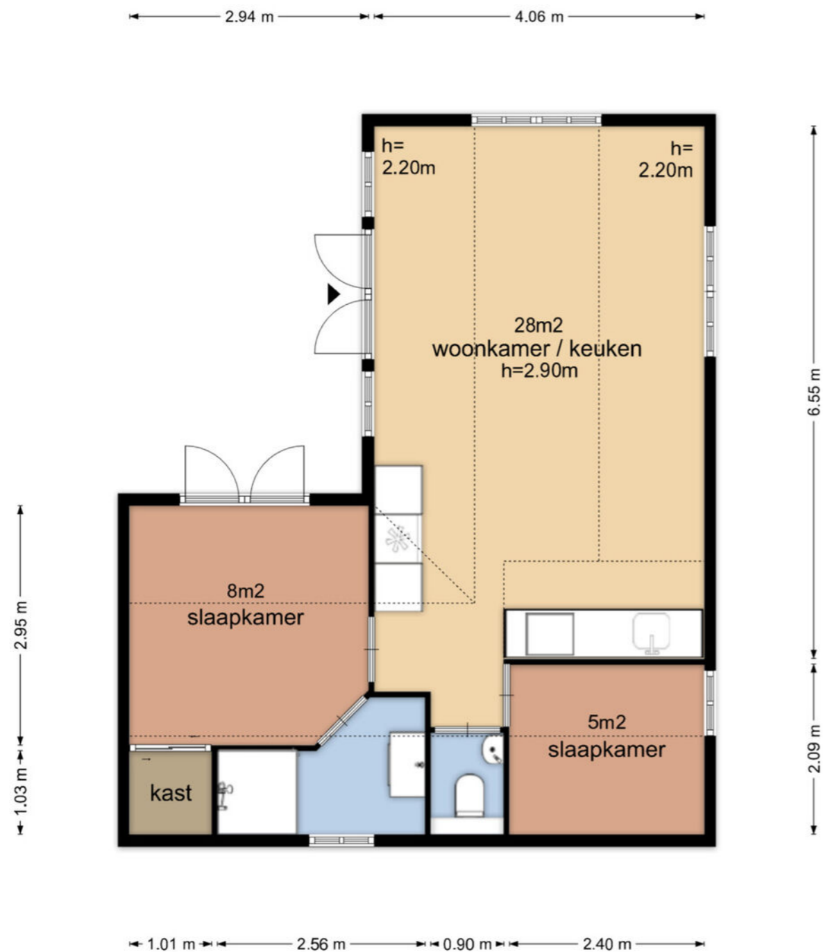
Bloklaan 22A-GP31 - Loosdrecht Begane Grond

De plattegronden zijn geproduceerd voor promotionele doeleinden en ter indicatie. Aan de plattegronden kunnen geen rechten worden ontleend © www.vistaview.nl